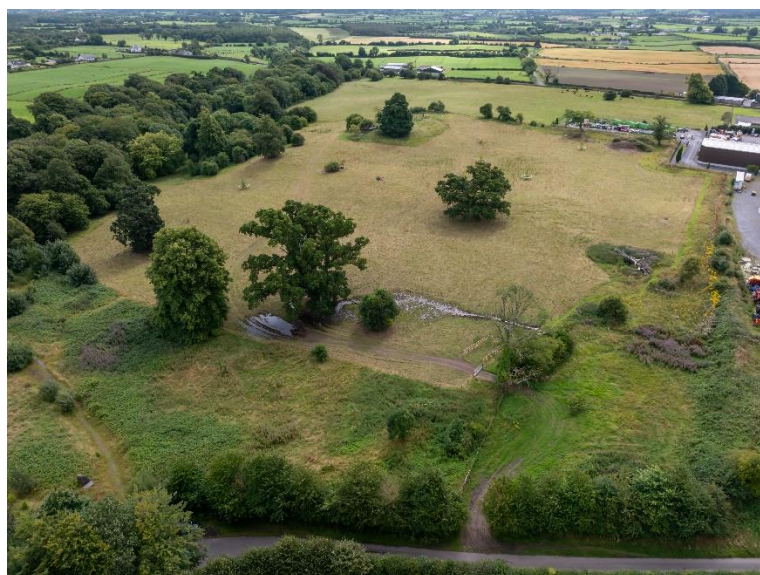
Grianghraf: Grianghraf ón aer – Paul Moore

Tagann an dúlra agus saol eile ar fad le chéile ar theorainn thiar Syngefield, áit ar forbraíodh limistéar mór tionsclaíochta le blianta beaga anuas. Tá cuid de sin folaithe ag claífort agus fál sceach dúchasach a cuireadh le déanaí, a fhásfaidh de réir a chéile chun na láithreáin a dheighilt óna chéile tuilleadh. Tá pleananna i bhfeidhm chun limistéar bogaigh a bhunú ar an teorainn chun an t-uisce dromchla a ritheann ó na limistéir chrua a bhainistiú. Beidh an bogach ina mhaolán ina ndéanfar an t-uisce dromchla a bhailiú agus a scagadh, agus ansin rachaidh an sruth uisce ar aghaidh chuig locháin nua, ina mbeidh gnáthóga a oirfidh d’amfaibiaigh, inveirteabraigh uisceacha agus plandaí.