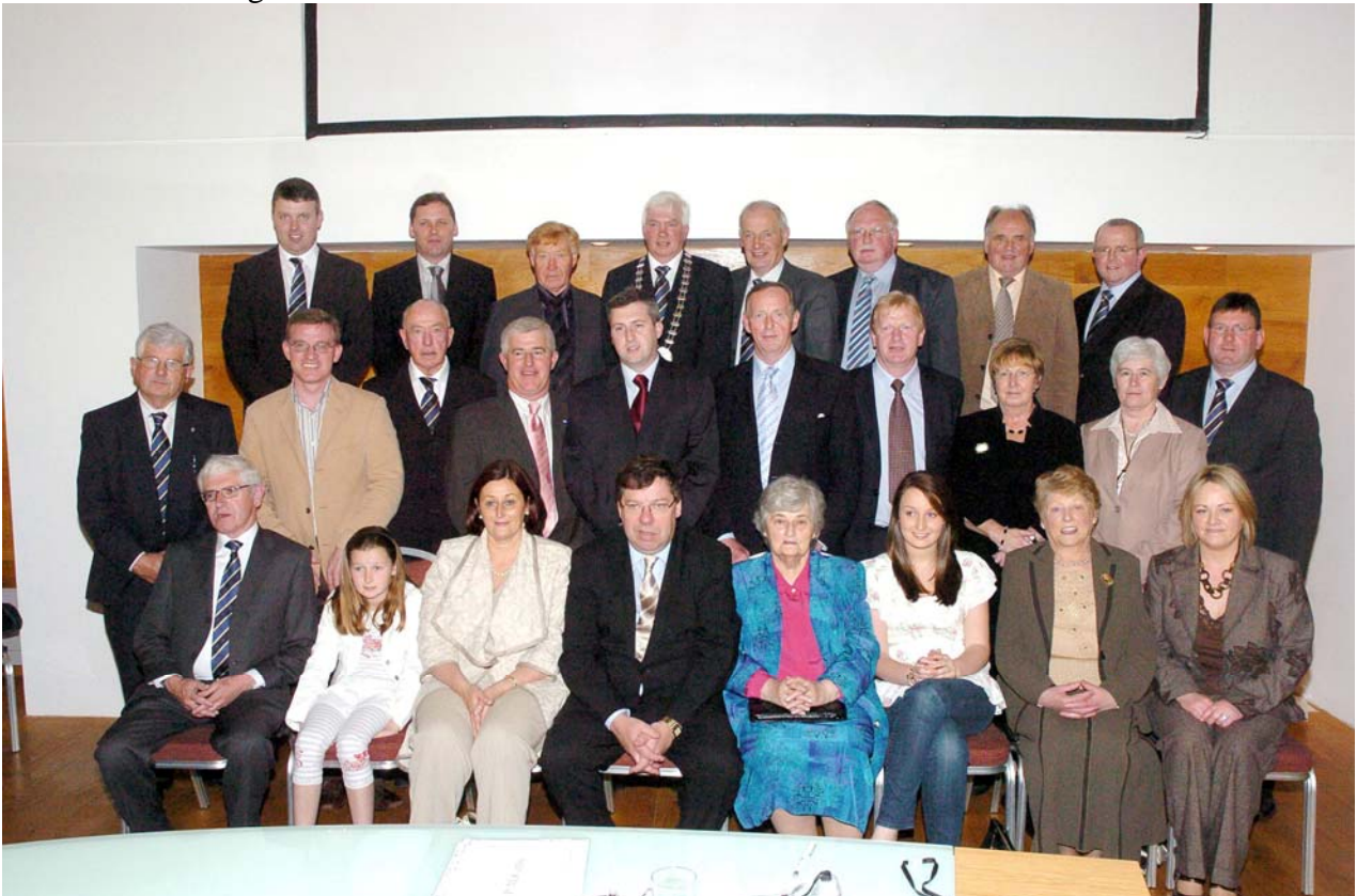
An Taoiseach, An t-Uas. Brian Cowen, T.D., Seomra na Comhairle, Áras an Chontae, 10 ú Bealtaine 2008

Bhí Fáiltiú Sibhialta chun onóir a thabhairt don dTaoiseach, An t-Uas. Brian Cowen, T.D. ar siúl ar an 10 ú Bealtaine ag Áras an Chontae.