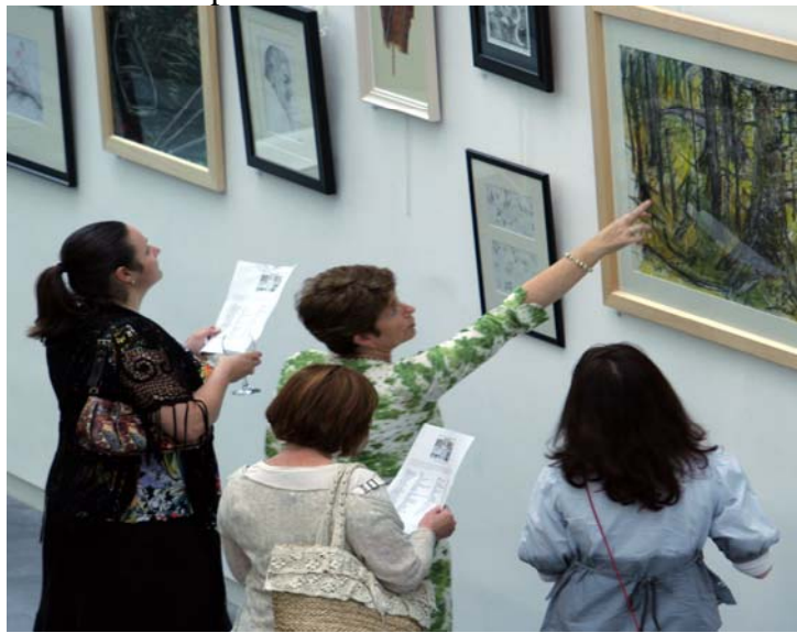
Oscailt Fhéile na n-Aighnithe Oscailte ag taispeáint saothar ó Ealaíontóirí Uíbh Fháilí