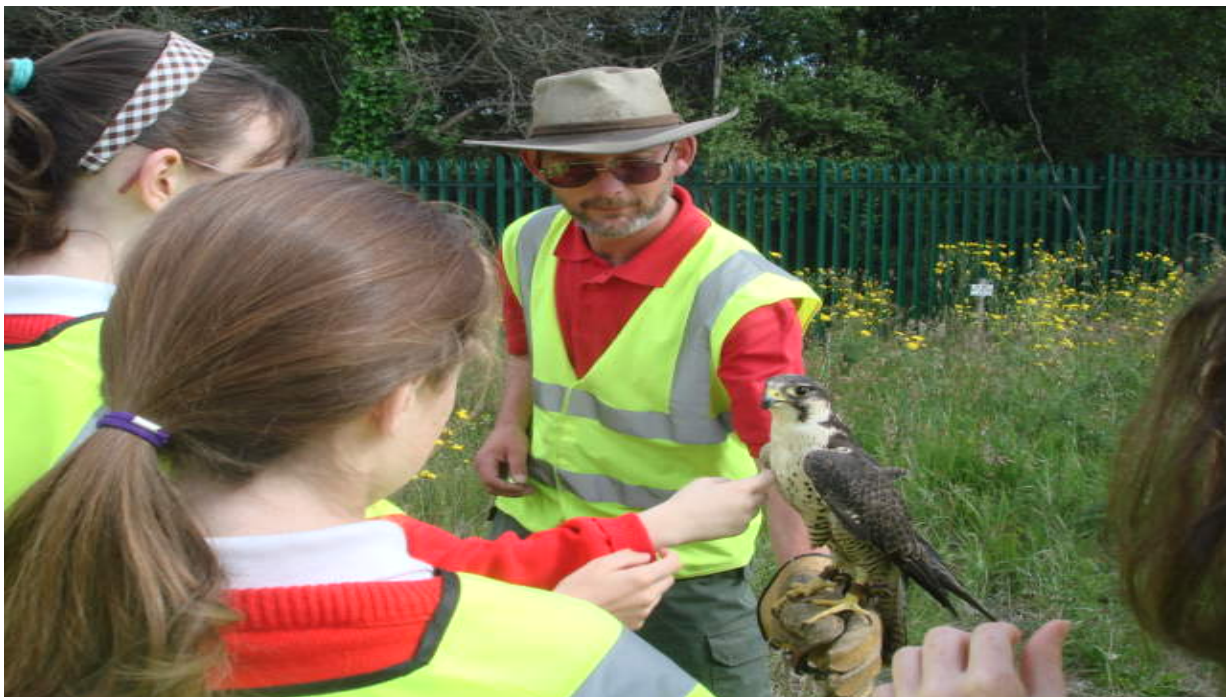
Comhairle na nÓg: Aithne ar d'Údarás Áitiúil, Líonadh Talún Dhoire Cluthar

Tá Rannóg Tréidliachta Chomhairle Chontae Uíbh Fháilí freagrach as feidhmeanna a chur i gcrích maidir le Cosaint Bia agus le Smachtú Galair. Cuireann sé i bhfeidhm téarmaí agus coinníollacha Chonradh Seirbhíse idir Údarás Sábháilteachta Bia na hÉireann (USBE) agus Comhairle Chontae Uíbh Fháilí maidir le marú ainmhithe do bhia, agus cuireann sé smachta reachtúla ar feoil a tháirgeadh, ar tháirgí feola agus ar éanlaith. Baineann a fheidhmeanna príomha maidir le sábháilteacht bia le Seamlais Bheaga, le Ceadú Seamlas agus Ceadúnú Fear Seamlais; ceadú agus maoirseacht ar fhoirgnimh bheaga próiseála feola; agus maoirseacht agus cigireacht ar shealúchas táirgí reachtaireachta.