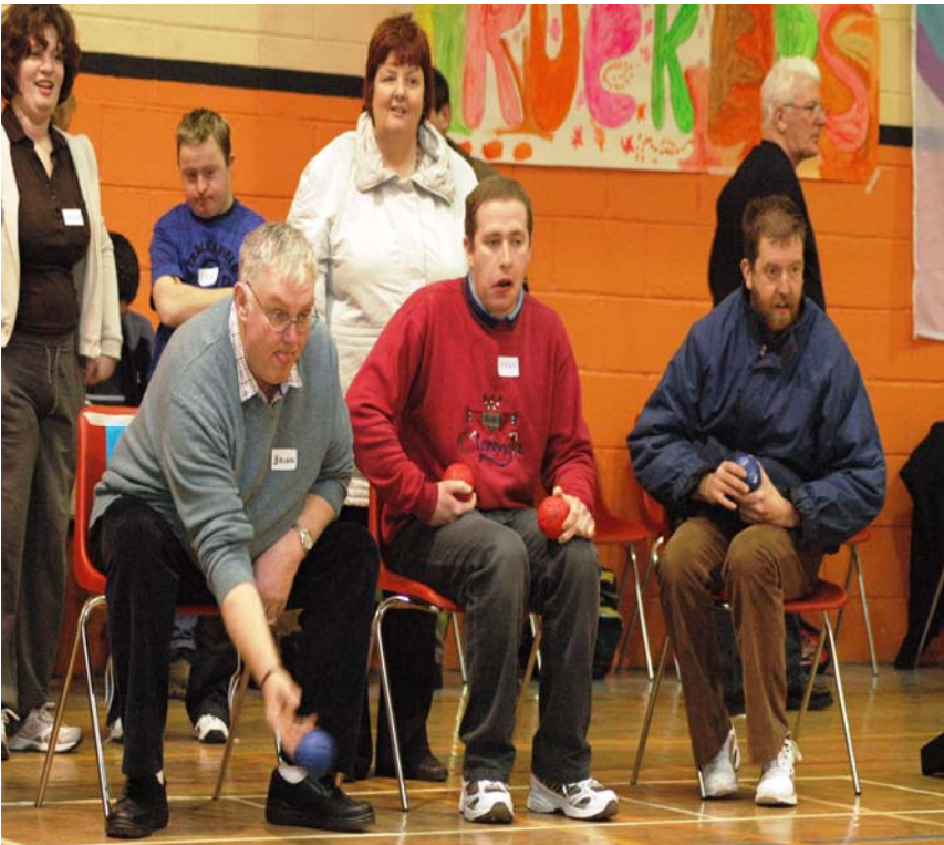
Páirtíocht Spóirt Uíbh Fháilí

D'eisíodh Ráitis faoi Bhronntanais agus Dearbhaithe Leasanna Faighte ag gach ball de Chomhairle Bhaile Éadan Doire.