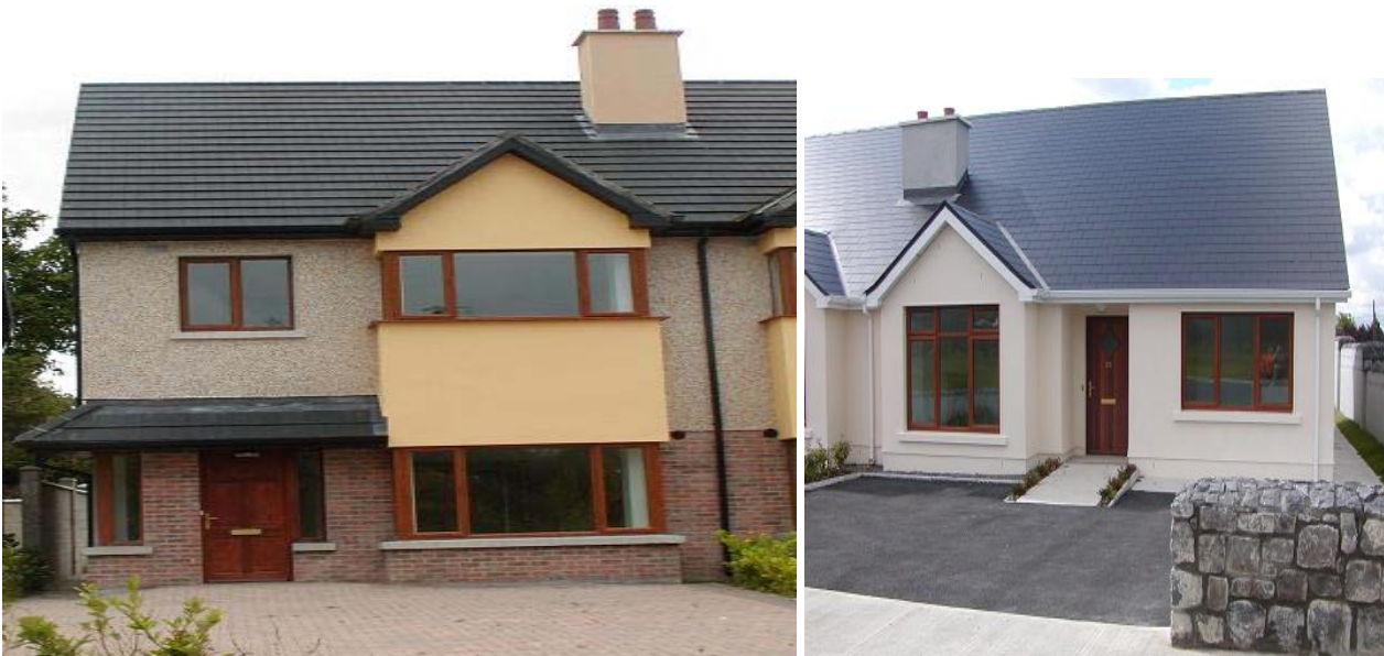
Tithe In-acmhainn: Gleann Comáin, Suí an Róin agus Garrán an Fhraoigh, Clóirtheach

Ceannaíodh aonaid in-acmhainn Cuid V le linn 2008 i bhforbairtí tithíochta príobháideacha i gClóirtheach agus sa Chlochán. Laghdaigh aschur ón bpróiseas seo go mór leis an gcor chun donais eacnamaíochta agus táthar ag súil go leanfaidh an nós seo i 2009.