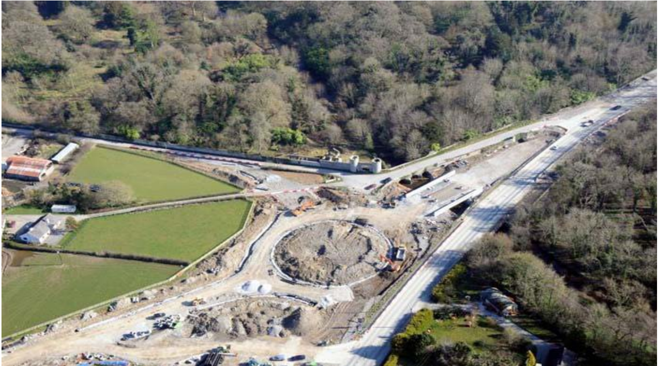
Radharc ón aer ar Thimpeallán an Mhuclaigh & S02: Fo-dhroichead na Clóidí