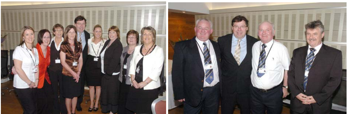
Taoiseach, Mr. Brian Cowen, T.D., Seomra na Comhairle, Áras an Chontae, 10 ú Bealtaine 2008

Is féidir le haoinne go bhfuil suim acu páirt a ghlacadh san Chosaint Sibhialta teagmháil a dhéanamh le Oifigeach an Chosaint Sibhialta, ag an Stáisiúin Dóiteáin Lárnach an Tulaigh Mhóir.