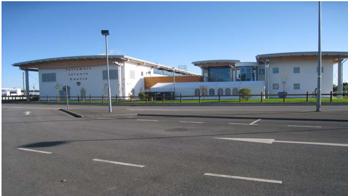
D'oscail Ionad Fóillíochta an Tulaigh Mhóir i nDeireadh Fómhair 2008