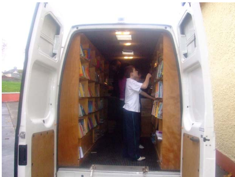
Leanaí ag roghnú leabhar le linn cuairt ó Sheirbhís Leabharlann Scoile Chontae Uíbh Fháilí chuig a scoil.

Thug an Roinn Oideachais agus Eolaíochta sa bhreis ar €43,000 le haghaidh stoc a cheannach do bhunscoileanna. Soláthraíonn Roinn Scoile Seirbhís Leabharlanna an Chontae seirbhísí leabharlanna do sa bhreis ar 9,500 leanbh ins an 68 mbunscoil. Thug foireann na leabharlanna cuairt ar gach scoil chun seirbhísí a chur chun cinn agus a soláthar. Tá na leabhair roghnaithe go cúramach ag foireann an Roinn Scoile chun riachtanais na scoile aonaraí a shásamh. Tugann a lán múinteoirí cuairt ar Roinn Leabharlanna na Scoile, chomh maith, agus éascaítear iad ag déanamh a rogha féin agus tugtar comhairle dóibh faoin réimse acmhainní ar fáil.