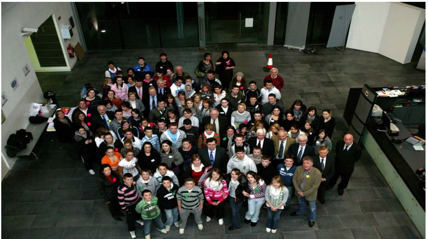
Toghchán Chomhairle na nÓg, Samhain 2008

Leanfaidh an Roinn P & F ag tabhairt tacaíochta do thionscnaimh eile le linn 2009 mar Dhuaisianna Cathaoirligh Chomhairle Chontae Uíbh Fháilí, ag forbairt ionad deonaí do Bhród As d' Áit Uíbh Fháilí, ag cur an cleachtas is fearr chun cinn agus uasghrádú an phobail, rannpháirtíocht leanúnach i gClár Oideachais Outreach Uíbh Fháilí agus rannpháirtíocht i nGrúpa Idir-ghníomhaireachta Bord Forbartha an Chontae maidir le míchumas.